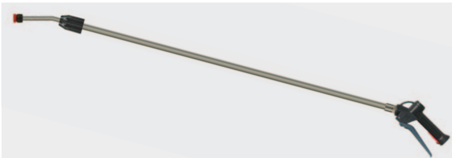
Пистолеты для химии с телескопическим копыем

Пистолет с химически устойчивым шариком из нерж. стали. Трубка из нерж. стали для мундштука форсунки. Без форсунки. Макс. 25 bar / 70 л/мин / 50 °C