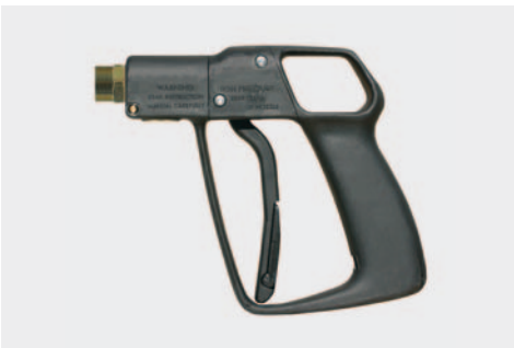
ST-810 низкое давление

Пистолет с POM седлом. Химически устойчив. Макс. 140 bar / 30 л/мин / 80 °C