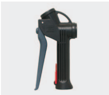
Пистолеты для химии

Пистолет с химически устойчивым шариком из нерж. стали. Макс. 25 bar / 70 л/мин / 50 °C