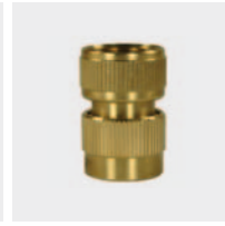
IG. Латунь. С плоским уплотнением