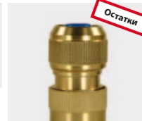
Латунь. С натяжным винтом