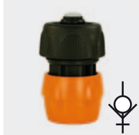
Пластмасса. С натяжным винтом и заглушкой для воды