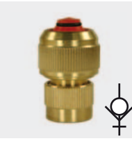
Латунь. С натяжным винтом и заглушка для воды