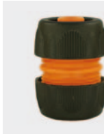
Пластмасса. С натяжным винтом