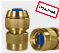
Латунь. С натяжным винтом

Премиум качество. Новое улучшенное исполнение с 6 шариками из нерж. стали.