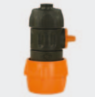
Пластмасса. С натяжным винтом и запорным краном