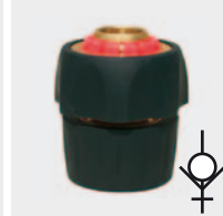
Латунь и резина. С натяжным винтом и заглушкой для воды