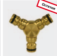
3-ход. распределитель. Латунь