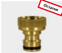
IG. Латунь. С плоским уплотнением