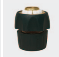
Латунь и резина. С натяжным винтом