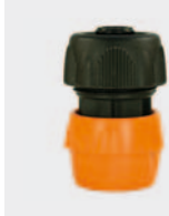
Пластмасса. С натяжным винтом