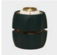
Латунь и резина. С натяжным винтом